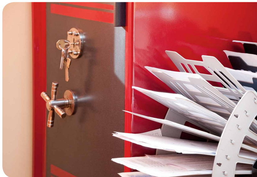
Zdarzają się przypadki umieszczania dokumentacji w zamkniętych szafach z kluczem pozostawionym w zamku.

Duże wątpliwości budzi również etap wdrożenia polityki bezpieczeństwa i instrukcji zarządzania systemem informatycznym. Często okazuje się bowiem, że na-