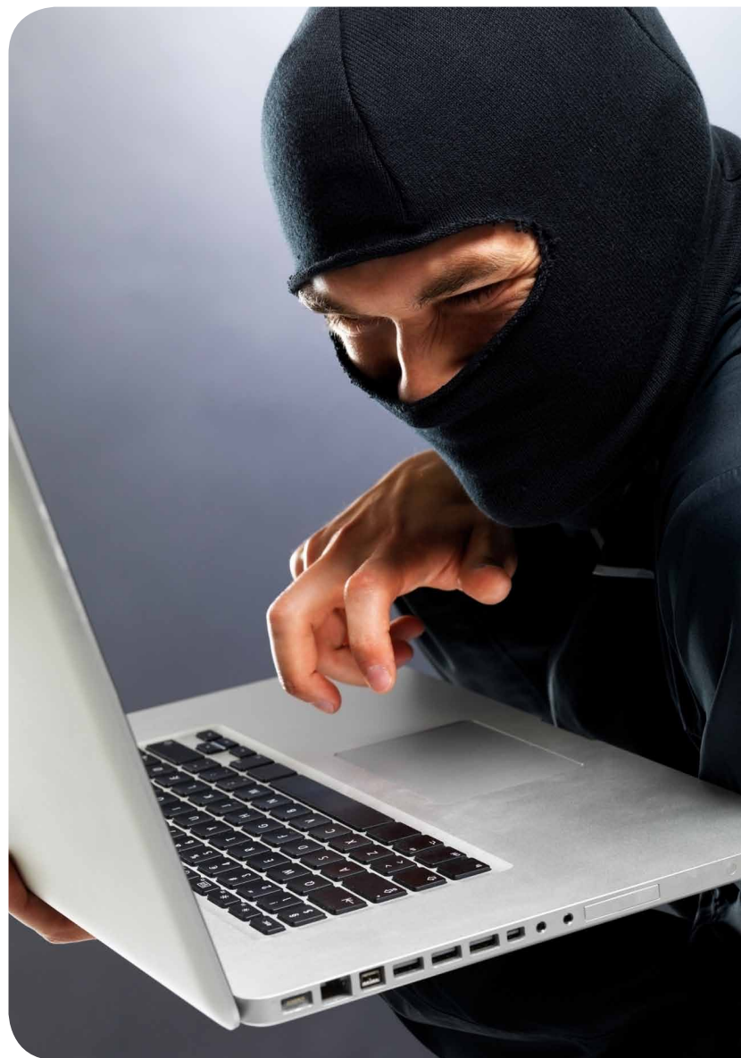
System informatyczny, w którym przetwarzane są dane osobowe, należy odpowiednio zabezpieczyć przed działaniami hakerskimi